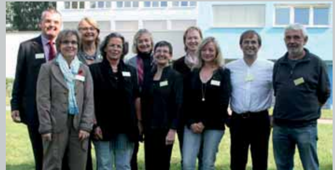
Der Arbeitskreis AIDS / STI Rheinland-Pfalz Nord